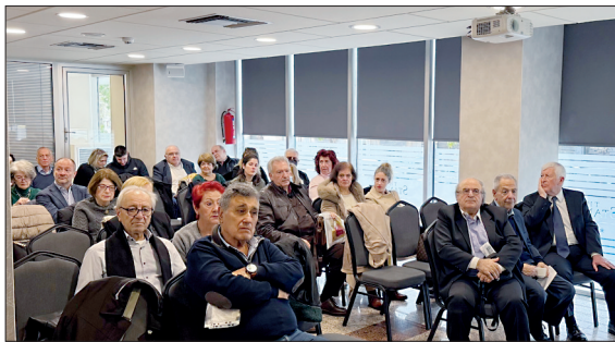
Μέρος της αίθουσας.

Παράλληλα με την ομιλία του προέδρου, έγινε και προβολή φωτογραφιών που είχε επιλέξει ο ίδιος. Ο πρόεδρος ευχαρίστησε ιδι-