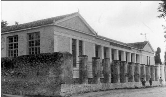
Το Δημοτικό Σχολείο Επιταλίου την δεκαετία του 1950.

Εμείς που γεννηθήκαμε και μεγαλώσαμε στο Επιτάλιο (Αγουλινίτσα) δεν είχαμε και πολλά επιβλητικά οικοδομήματα-κτίσματα. Πλεόναζαν τα ισόγεια, τα μονώροφα, τα πλινθόκτιστα και ελάχιστα ήταν πετρόκτιστα. Οστόσο ξεχώριζαν οι δύο εκκλησίες μας, (του Αγίου Νικολάου και του Αγίου Χαράλαμπος),