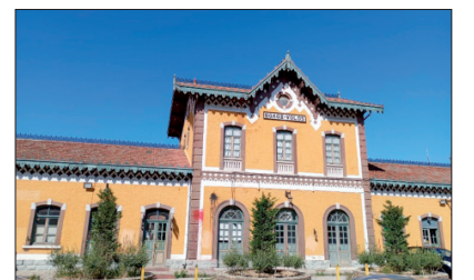
Ο σιδηροδρομικός σταθμός του Βόλου είναι κλειστός από τον Σεπτέμβριο του 2023. Το μηχανοργείο του ΟΣΕ Βόλου είχε κλείσει νωρίτερα. Συντηρούσε τα τρένα της γραμμής του Πηλίου (0,60 μ.) του Θεσσαλικού σιδηροδρόμου Βόλου-Καθαμπάκας (1 μ.) και των διεθνών γραμμών, πλάτους 1,50 μ., Βόλου-Λάρισας. Το επιβατικό κοινό εξυπηρετείται αποκλειστικά με το ΚΤΕΛ.

ΥΓ. Με τα αγροτικά αγαθά της Θεσσαλίας ασχολήθηκα επαγγελματικά και μη για 30 χρόνια. Χάρη στα τρένα φοίτησα στο Γυμνάσιο του Πύργου και έμαθα γράμματα. Τέλος μετακινήθηκα με τις τρεις γραμμές του ΟΣΕ Βόλου προς όλες τις κατευθύνσεις.