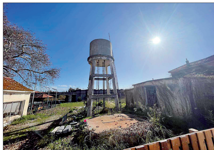
Επιτάλιο: Οι παλιές εγκαταστάσεις του ΑΣΟ με τον μοναδικό υδατόπυργο.

παλαιά και σύγχρονα ονόματά τους. Το βιβλίο περιέχει χάρτες, πληθυσμιακούς πίνακες των χωριών με σύντομη ιστορία τους, νομοθεσία της εναποστατικής περιόδου για την διοίκηση των επαρχιών κλπ. Ένα βιβλίο ιδιαίτερα χρήσιμο σε όλους εκείνους που ενδιαφέρονται να εμβαθύνουν στην ιστορία της επαρχίας μας και μπορούν να το προμηθευτούν στα βιβλιοπωλεία. Σ.Φ.