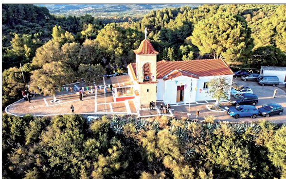
Ο Αι Γιώργης, την ημέρα του εορτασμού του

Αν και όψιμο το Πάσχα φέτος, εορτάστηκε με άστατο καιρό. Πολλοί οι ετεροδημότες που πέρασαν τις άγιες ημέρες στο χωριό. Και συμπατριώτες, και φιλοξενούμενοι, αλλά...Βρε παιδιά, βγειτε λίγο και στην αγορά να σας δούμε, να σας κεράσουμε... Οι επιτάφιοι και των δύο εκκλησιών ήταν πάρα πολύ ωραία στολισμένοι, για άλλη μια χρονιά. Του Αγίου Γεωργίου για άλλη μια χρονιά, δεν έγιναν ιπποδρομίες που το είχαμε αναβιώσει το έθιμο αυτό. Α ρε Δήμος Βώλακος, που τα κάναμε όλα μόνοι μας... Ο Καλλικράτης, μας έκανε να τα ξεχάσουμε.