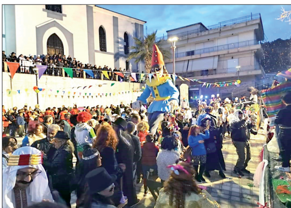
Στιγμιότυπα από το Επιταλιώτικο καρναβάλι