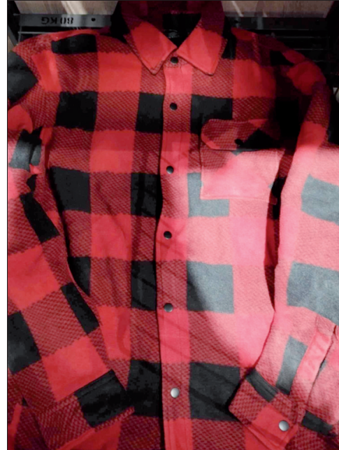
Πουκάμισο καρδ από τα δέματα της Αμερικής.

Ο Σκιαθίτης Παπαδιαμάντης, στα διηγήματά του για τους μετανάστες, χρησιμοποιεί με πολλή τέχνη τη λέξη «ΦΙΛΑΔΕΛΦΕΙΑ» - πόλη της Αμερικής αλλιώς και αδελφική αγάπη.