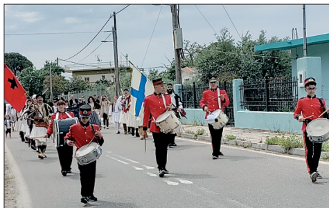
Κυριακή: Παρέλαση προς το μνημείο της μάχης, στην πευκόφυτη περιοχή του Αϊ-Γιάννη.

μαθήτριες του Δημ. Σχολείου και του Γυμνασίου Επιταλίου, φώτισαν τα σκοτάδια της ιστορικής λήθης και άγνοιας, λαμβάνοντας μέρος σε μία εντυπωσιακή λαμπαδηφορία, κατευθυνόμενοι συμβολικά από την έδρα του Πολιτιστικού Συλλόγου «Επί της αλός» (αρχοντικό Μαστροβασιλόπου-