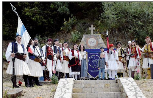
Από την τελετή στο μνημείο της μάχης.

Κυριευμένοι από κούραση, την οποία όμως εξαφανίζει η χαρά και η ικανοποίηση των συγχωριανών μας για ό,τι πρωτόγνωρο έγινε το διήμερο της 7ης & 8ης Μαΐου, μια χαρά και ικανοποίηση που έγινε παράκληση, για να μετατραπεί ακαριαία σε αιχμαίτηση, να επαναληφθούν οι επετειακές αυτές εκδηλώ-