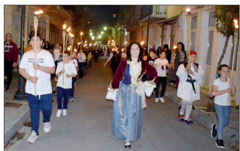
Η λαμπαδηφορία Σάββατο βράδυ.

Την Κυριακή 8 Μαΐου, η καμπάνα του πολιούχου μας Αγίου Χαραλάμπους μας ξύπνησε, για να φορέσουμε τα καλά μας,