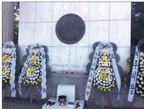
Μνημείο Ελληνικού Εκστρατευτικού Σώματος στην Κορέα

Τα χρόνια πέρασαν και εμείς διαφύγαμε α-