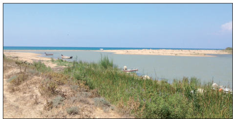
Εκβολές Αλφειού 2012. Επιταλιώτικες δάρες έχουν "δέσει" στην αριστερή όχθη

Το 1836 το τελωνοφυλάκειο του Αλφειού αναβαθμίζεται σε τελωνιακό σταθμό με προσωπικό έναν Αρχιφυλάκα, με μηνιαίο μισθό 40 δρχ. και επιπλέον αποζημίωση 3 δρχ. μηνιαίως για γραφική ύλη, θέρμανση, φωτισμό, καθαριότητα κλπ. Τον Ιούνιο του 1842 ο Αρχιφυλάκας του τελωνιακού σταθμού Αλφειού μετονο-