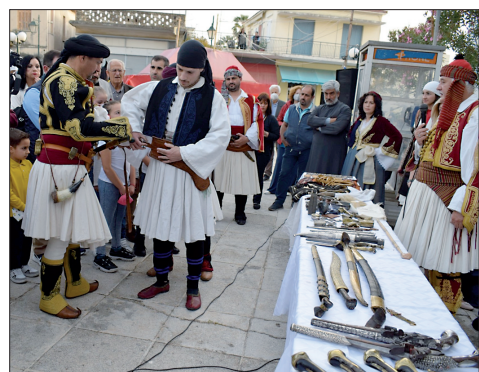
Έκθεση και επίδειξη αυθεντικών αρμάτων του 1821, στην πλατεία του Αγ. Χαραλάμπους.

λουν) προς το μνημείο της μάχης, στην τοποθεσία «Αϊ-Γιάννης». Στην επιστροφή, η χορευτική ομάδα του Λυκείου των Ελληνίδων (παράρτημα Πύργου), καθώς και οι μαθητές και οι μαθήτριες του Γυμνασίου Επιταλίου, περίμεναν όλους τους συμμετέχοντες στη λαμπαδηφορία,