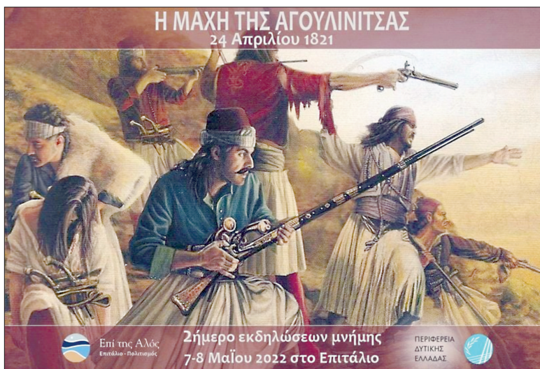
Η ΜΑΧΗ ΤΗΣ ΑΓΟΥΛΙΝΙΤΣΑΣ 24 Απριλίου 1821

μαθήτριες του Δημ. Σχολείου και του Γυμνασίου Επιταλίου, φώτισαν τα σκοτάδια της ιστορικής λήθης και άγνοιας, λαμβάνοντας μέρος σε μία εντυπωσιακή λαμπαδηφορία, κατευθυνόμενοι συμβολικά από την έδρα του Πολιτιστικού Συλλόγου «Επί της αλός» (αρχοντικό Μαστροβασιλόπου-