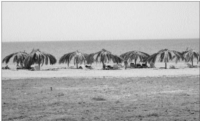
Ο φετινός εξωραϊσμός και η αναβάθμιση της παραλίας.

ρου, καλής ποιότητας φαγητό και ποτό σε λογικότερες τιμές. Το περίπτερο έγινε φέτος χώρος συνάντησης και επαφών πολλών επισκεπτών και παραθεριστών Επιταλιωτών. Τα Σαββατοκύριακα οι πελάτες του περιπέ-