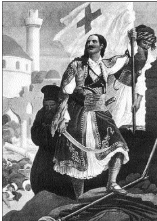
Η ΑΛΩΣΗ ΤΗΣ ΤΡΙΠΟΛΙΤΣΑΣ (του P. von HESS)

«Τη Δευτέρα επέρασαν εις Πύργον, έκαψαν Αηπτοσεληπή, Ανεμοχώρι, Λαδικού, Βρύνα, Ρίσοβο, Μακρύσια, Κρέστενα, από ένα μέρος εις αυτά, μέρος Αγουλινίτσας- έκαψε το τρίτο. Έκαψε και τον Πύργο και πέρασε κατά Γαστούνη. Δεν ξέρω αν άφησε στον Πύργο τίποτα...12-11-1825.» Δ. Κανελλόπουλος