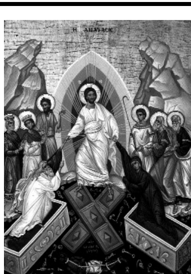
ΤΟ Δ. ΣΥΜΒΟΥΛΙΟ ΕΥΧΕΤΑΙ ΚΑΛΗ ΑΝΑΣΤΑΣΗ ΚΑΙ ΚΑΛΟ ΠΑΣΧΑ